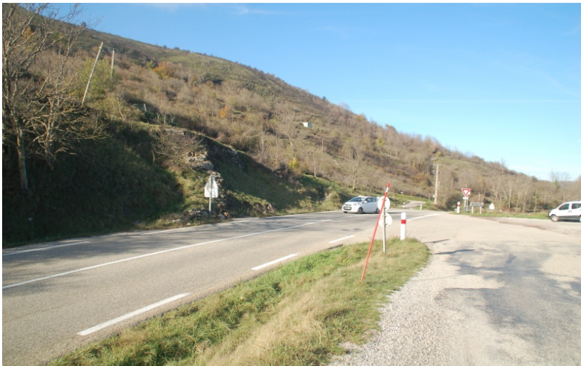
FR-07-0787 Col de l'Esnet