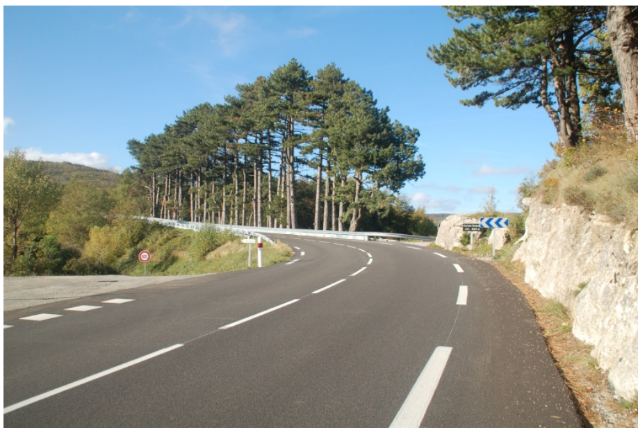
FR-07-0682 Col de L'Arénier