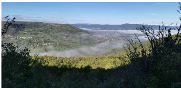
Serre Gaillard