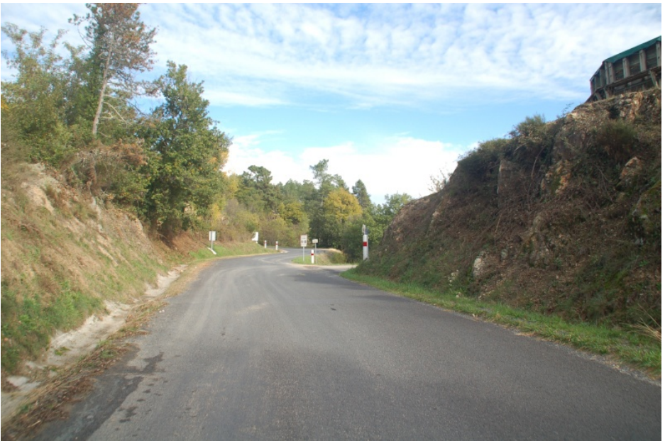
Col de Vals FR-07-0402