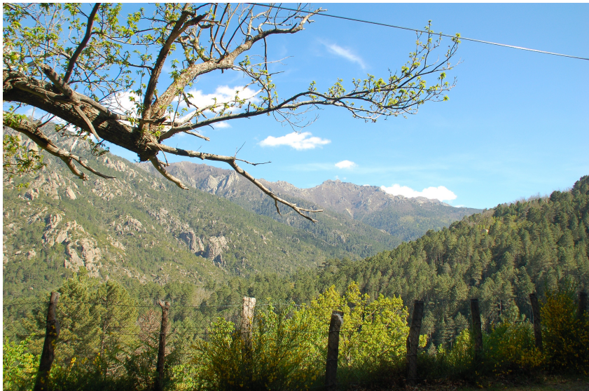
Vue vers la Punta di Campiglione