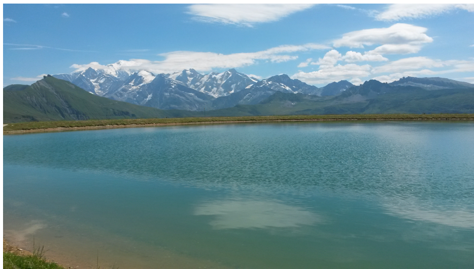
Lac de retenue au-dessus du col de la Péchette

(FR-73-1517a). Continuer la piste en laissant à droite le sentier qui se dirige vers le Roc des Evettes (dévers, racines). Dans le premier lacet, prendre la petite piste roulante à droite qui s'enfonce dans la forêt, pour devenir un large sentier qui monte dans le final pour atteindre le Golet (FR-73-1480b). Prendre en face pour descendre vers le restaurant d'altitude de « la Montagnette » (attention dalle rocheuse parfois glissante au départ). Dans la descente point d'eau au niveau d'un chalet. Après le passage du téléski, possibilité de faire un petit détour à droite jusqu'au paisible lac des Evettes. Reprendre la piste au niveau de « la Montagnette » et descendre jusqu'au départ du téléski du lac. Continuer la piste à droite et faire un arrêt aux fontaines pétifiantes. Au carrefour du « Mariage » prendre la piste à droite vers Praz sur Arly. Au niveau du parking on récupère le bitume qui vous ramène au niveau du pont sur l'Arly que l'on traverse pour rejoindre la D1212 , prendre à droite pour rejoindre le Belambra.