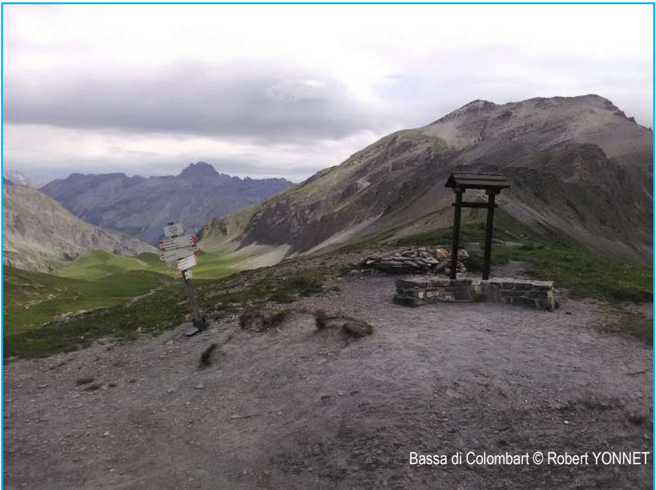
Bassa di Colombart

Près du parking, passer le petit pont en direction de Ferriere , la route est goudronnée mais grimpe sérieusement sur 5 km, à la borne Ferriere, ne pas descendre au village prendre la piste à droite (panonceau MTB E Bicke A31) vous passez au Colletto Ferriere 2044 mètres . 800 mètres plus loin, la piste vous amène à la Bassa di Colombart 2461m (250 mètres de poussage) ne pas oublier de sonner la cloche puis prendre la direction « Col de Pouriac », le sentier est très praticable (800 mètres). Au Colle di Puriac 2506 mètres , contourner par le sentier de gauche pour rejoindre la crête et la Bassa Ferriere 2576 mètres (645 mètres) aller et retour sur la piste puis la route goudronnée . Dans la descente de la route dans une épingle (4 km environ) prendre à gauche la piste 4x4 en terre qui part en descente sur 300m environ, la suivre jusqu'au bout (25% à certains endroits). A 1 km dans une clairière, juste avant un téléski, suivre le cheminement qui vous fait remonter jusqu'à l'arrivée du télésiège et donc au Colletto Incianao 2292 mètres . La descente est impressionnante, retour sur la route et le parking.