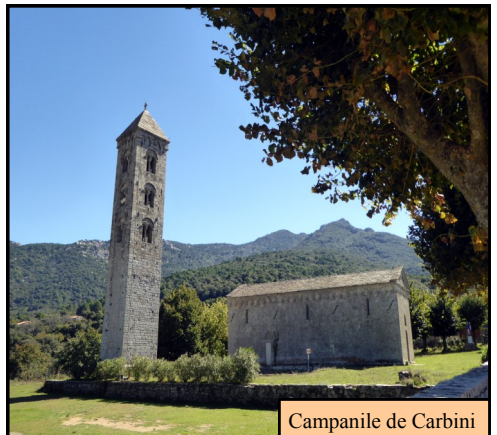
Campanile de Carbini