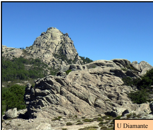
U Diamante 5