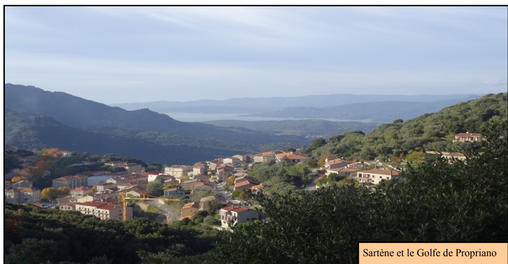
Sartène et le Golfe de Propriano