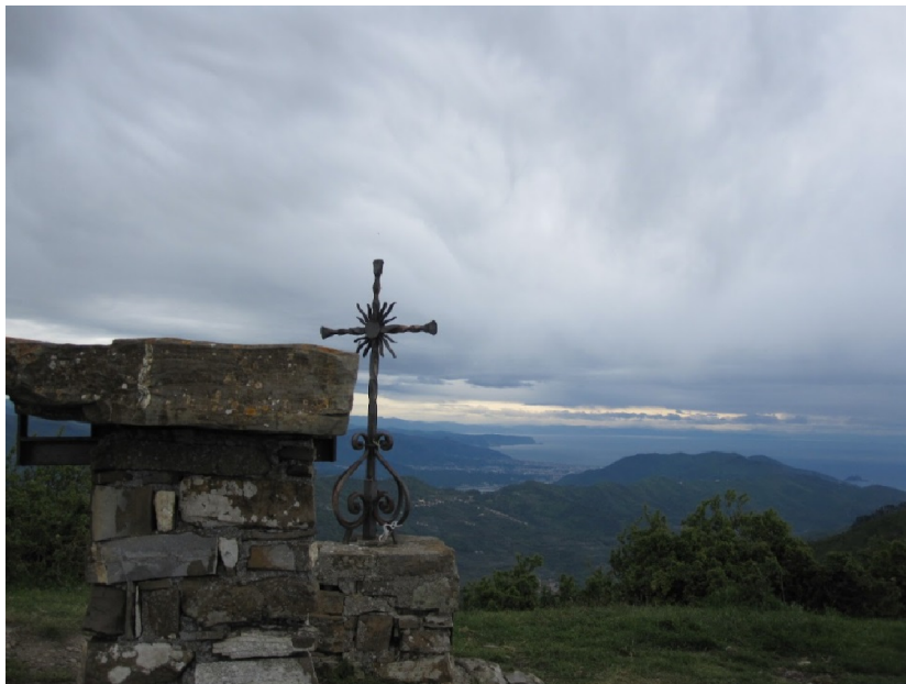
Monte Torre au Loin la plaine d'Albega

poursuivre la SP18 à droite vers [V5_15] et [V5_16] au lieu-dit Case Vecchie de San Damiano. Remonter la SP18 à gauche jusqu'au point [V5_17] , tourner à droite vers le Cimetière. A partir de ce point [R5_19] la route se transforme en piste R1-R2. L'approche de Colla Carpanea (562m) se fait par un sentier. Revenir vers Stellanello par le même chemin.