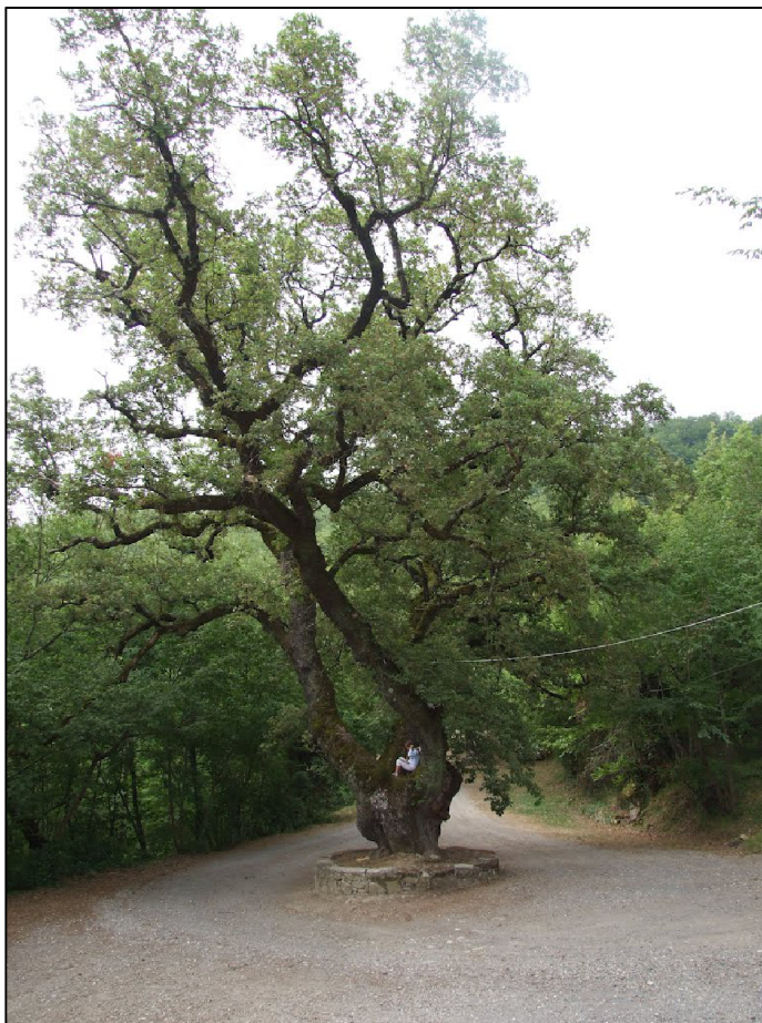
Place de la Chapelle

Revenir vers Stellanello par le même chemin.