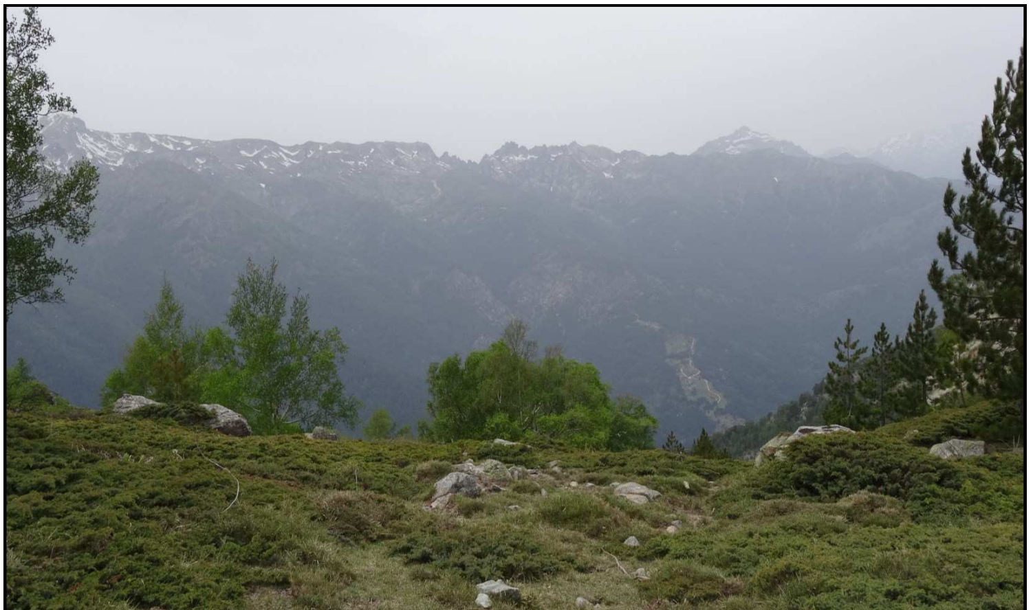
Crêtes enneigées vues depuis le col de Taoria