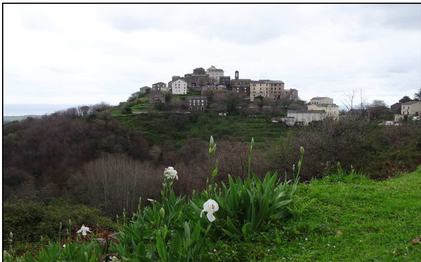
Chiatra juché sur son éperon rocheux